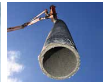
PANTARHEO® SE10 (BV) ▶ 07