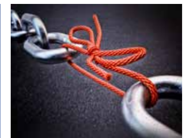
PANTARHEO® VMA 35 (VM) ▶ 09