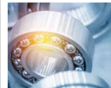
PANTARHEO® FA25 (ST) ▶ 05